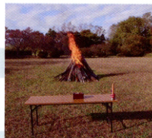
大崎塔婆お焚き上げ供養