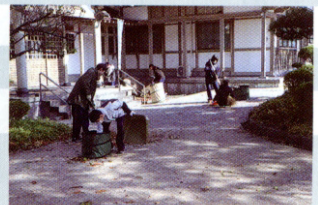
天王中学校キャリアスタート