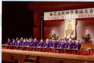
梅花流秋田県奉詠大会

10月 6日(金)～7日(土) 御本寺晋山式 14日(土) 終活相談会(長沼禅苑) 20日(金) 梅花流秋田県奉詠大会 (能代文化会館)