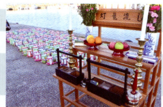
天王船越仏教会主催 灯笼流し